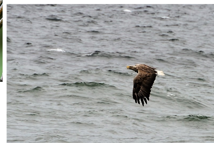
Havørn ses særlig mye i vinterhalvåret. Flere kjente sitteplasser. Her en voksen.