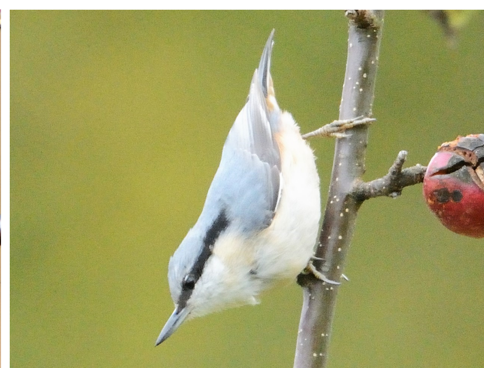
Spettmeis ble første gang sett i juni 1971, øst for Rein. Nå finner man den mange steder i sørligste halvdel av Berga, særlig der det vokser hassel og nøtter.