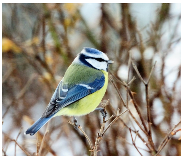
Blåmeis er vanlig særlig i randsonene.

Berga har et rikt fugleliv. Naturgrunnet her er svært gunstig med en kombinasjon av at berggrunnen og løsmassene er rike, og dette er det lokalklimatiske beste området for både vekster og dyreliv i Stadsbygd og i hele kommunen. Generelt er det mange sørvendte hellinger. Naturtyper og vegetasjon varierer mye, mye mosaikk, og med et meget rikt insektliv som mat for fugler. Vekstsesongen er lang i Berga.