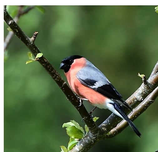
Dompap er til stede hele året, og hekker i skogen.