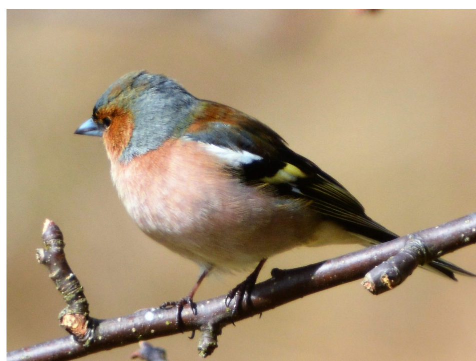
Bokfink (her hannen) hekker tett i de rike lauvskogene og kantskogene.