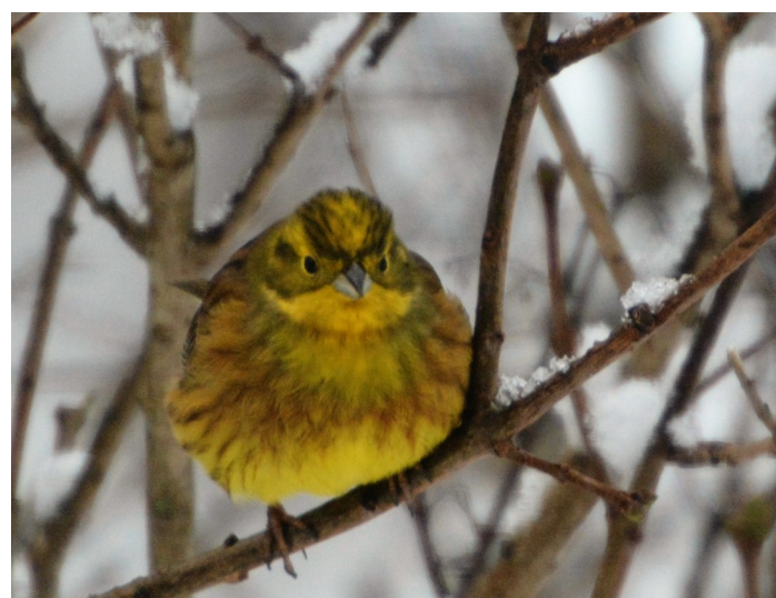
Gulspurv har gått mye tilbake og er nå kommet på rødlista ( NT-Nær truet ). Den er først og fremst knyttet til skogkantene mot dyrkamarka.