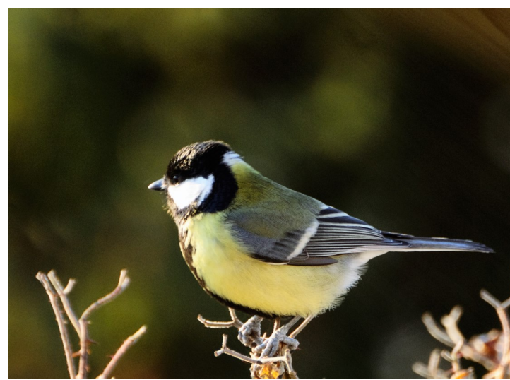
Kjøttmeis er vanlig hele året — ved bebyggelsen og i skogen.