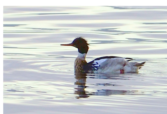
Siland — hekker — og ses det meste av året langs fjæra.