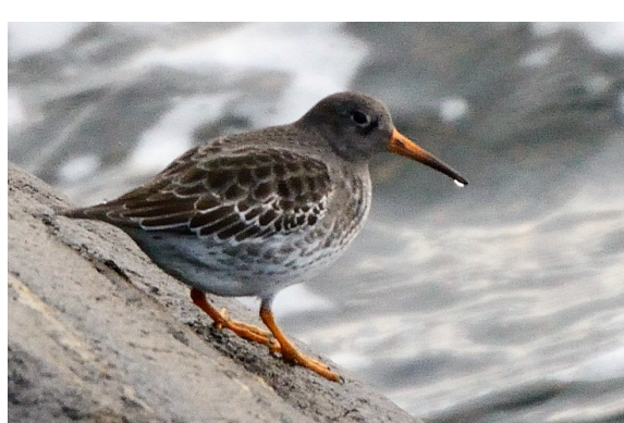
Fjæreplytt — vadefugl i fjæra her om vinteren.

Hele Berga er usedvanlig fuglerik. Det er mange enkeltvis punktlokaliteter av meget stor verdi for det rike fuglelivet, fordelt gjennom hele Berga. Her kan man registrere mange fuglearter gjennom en større del av året enn det som ellers er vanlig.