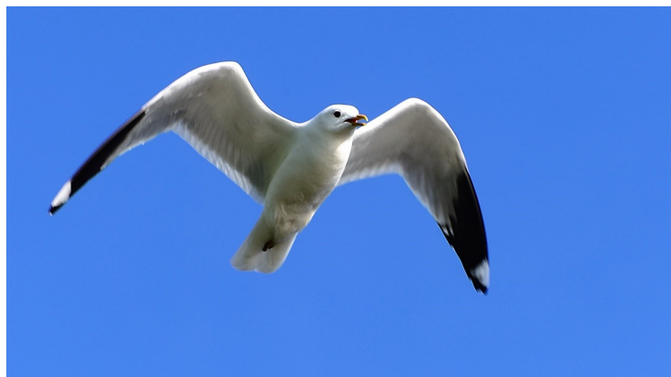
Fiskemåke har gått mye tilbake og er nå kommet på rødlista ( NT-Nær truet ). Randsonene til Berga er viktige som hekkeområder og for å finne mat.

I trekketidene om vår og høst er det store mengder trekkende fugler som raster.