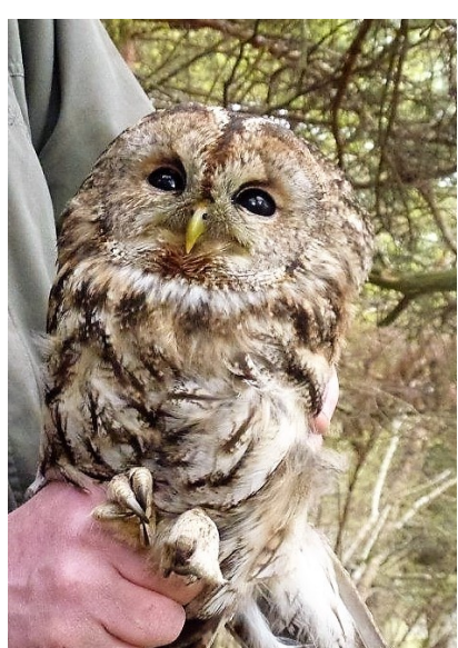
Kattugle — hekkende voksenfugl.