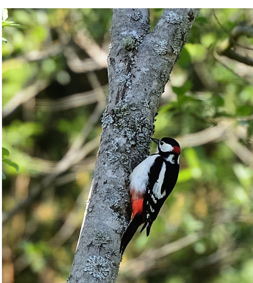
Flaggspett er vanlig å se i Berga og i randsonene.