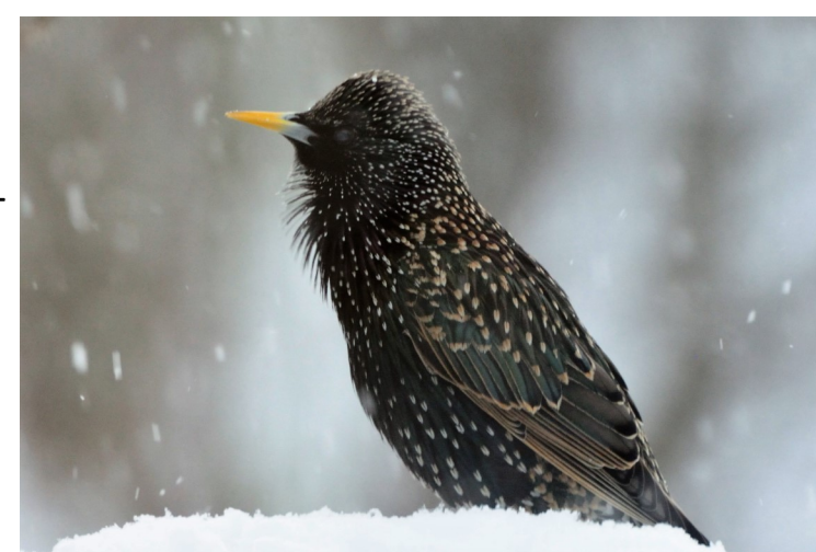
Stær var tidligere svært tallrik. Hekket overalt, og i store antall på seinsommeren. Den har gått mye tilbake og er nå kommet på rødlista ( NT-Nær truet ).