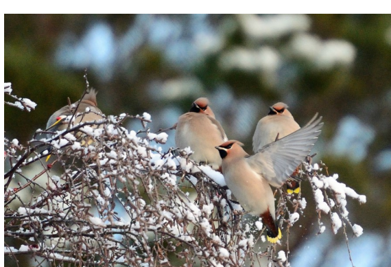
Sidensvans — i vinterhalvåret, oppsøker særlig rognebær.