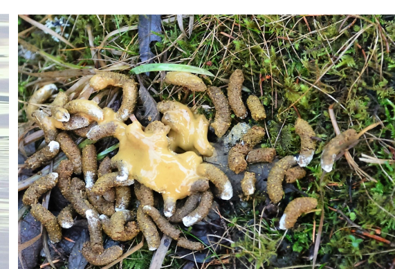
Jerpe — ekskrementer legges i hauger hos hønsefuglene.