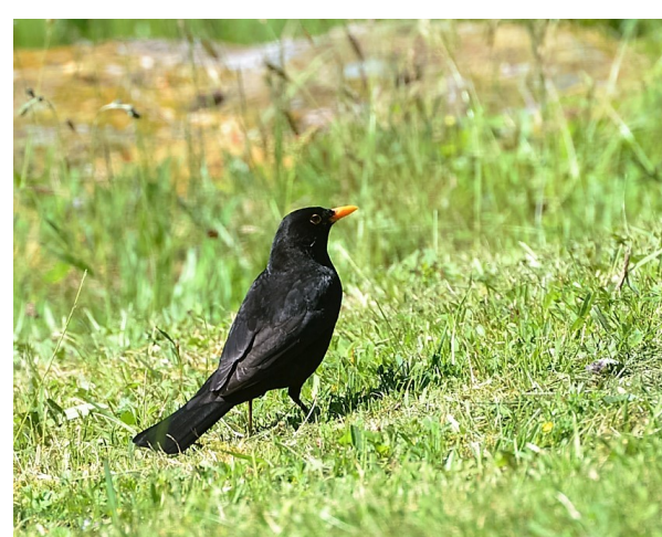
Svarttrost hekker tallrikt i det meste av Berga. Flere overvintrer, særlig hanner.