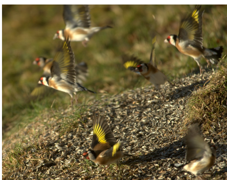
Stillits er først og fremst en vinterfugl her. En fargerik fugl. Vinteren 2017 var flokker på opptil 35 individer til stede.