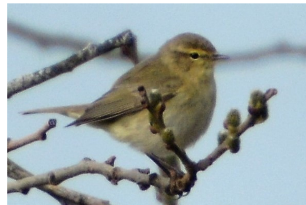
Gransanger hekker tett i deler av Berga. Særlig i de rike lauvskogene. Den kommer tidlig om våren her.