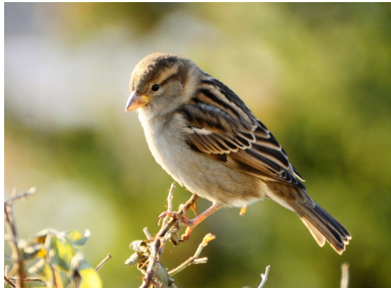
Gråspurv (her hunnen) er vanlig hele året ved hus og hager i randsonene til Berga.