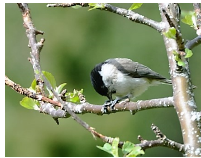
Lauvmeis hekker først og fremst i randsonene i Berga. Granmeisa som ser lik ut, er særlig vanlig i barskogen.