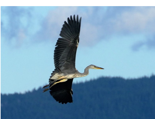
Gråhegre — fisker i fjæra, ses overalt, hekker i koloni.